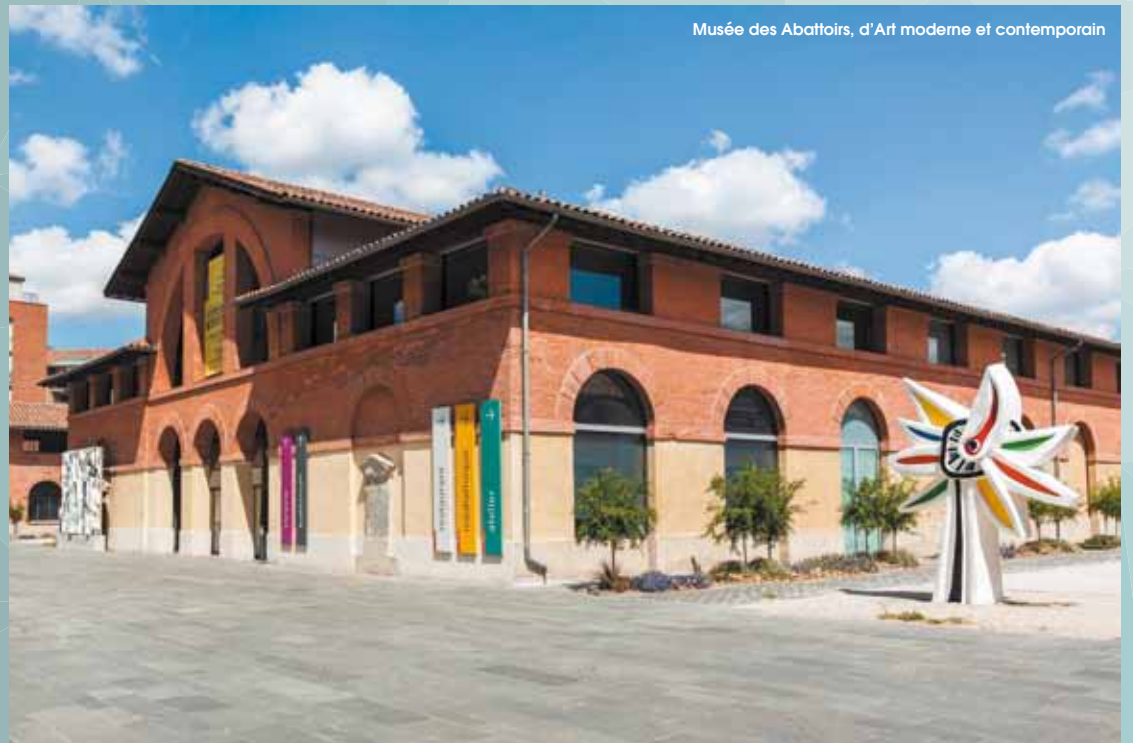
Musée des Abattoirs, d'Art moderne et contemporain