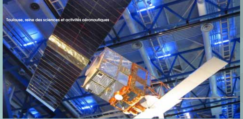
Toulouse, reine des sciences et activités aéronautiques

Son rayonnement économique, couronné par un Prix Nobel d'Économie en 2014 , s'apprécie tant au niveau national qu'international. Il permet à la ville de courtiser les grands chercheurs, scientifiques et universitaires de renom. Les leaders européens et mondiaux installent leur siège au cœur de la ville rose à l'image d'Airbus, Thales, Safran ou encore Continental.