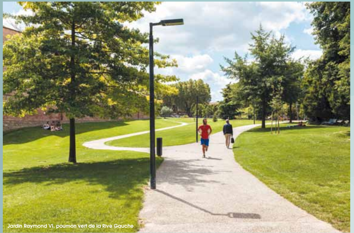
Jardin Raymond VI, poumon vert de la Rive Gauche