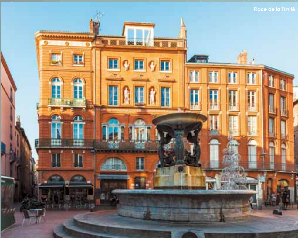
Place de la Trinité