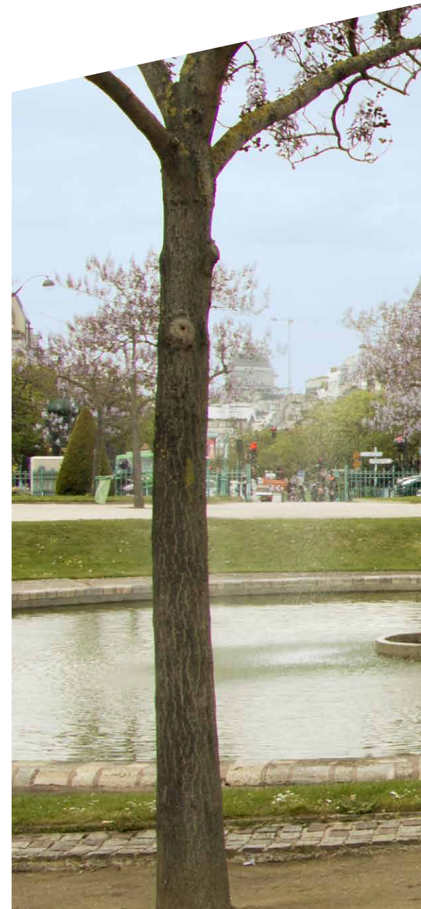
La Mairie donnant sur la place d'Italie