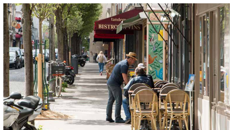
La rue de la Butte-aux-Cailles

CLCT Architectes Courcy - Lamas - Cornu Thenard