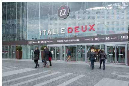
Le centre commercial

Toujours aussi résidentiel et paisible, le XIII e est devenu un arrondissement passionnant où s'invente l'avenir de Paris. En témoignent l'extension de l'université Paris-Diderot, la nouvelle École Nationale Supérieure de Paris-Val-de-Seine ou encore la Halle Freyssinet, extraordinaire incubateur numérique géant lancé par le bouillonnant Xavier Niel. Parfaitement connecté au centre de la capitale, abritant la Gare d'Austerlitz et le grand CHU de la Pitié Salpêtrière, le XIII e est aussi un arrondissement qui bouge par son intense activité culturelle.