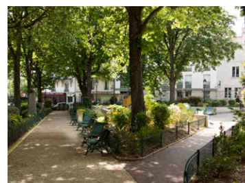
Le square Henri Rousselle