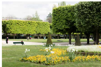
Le parc de Choisy