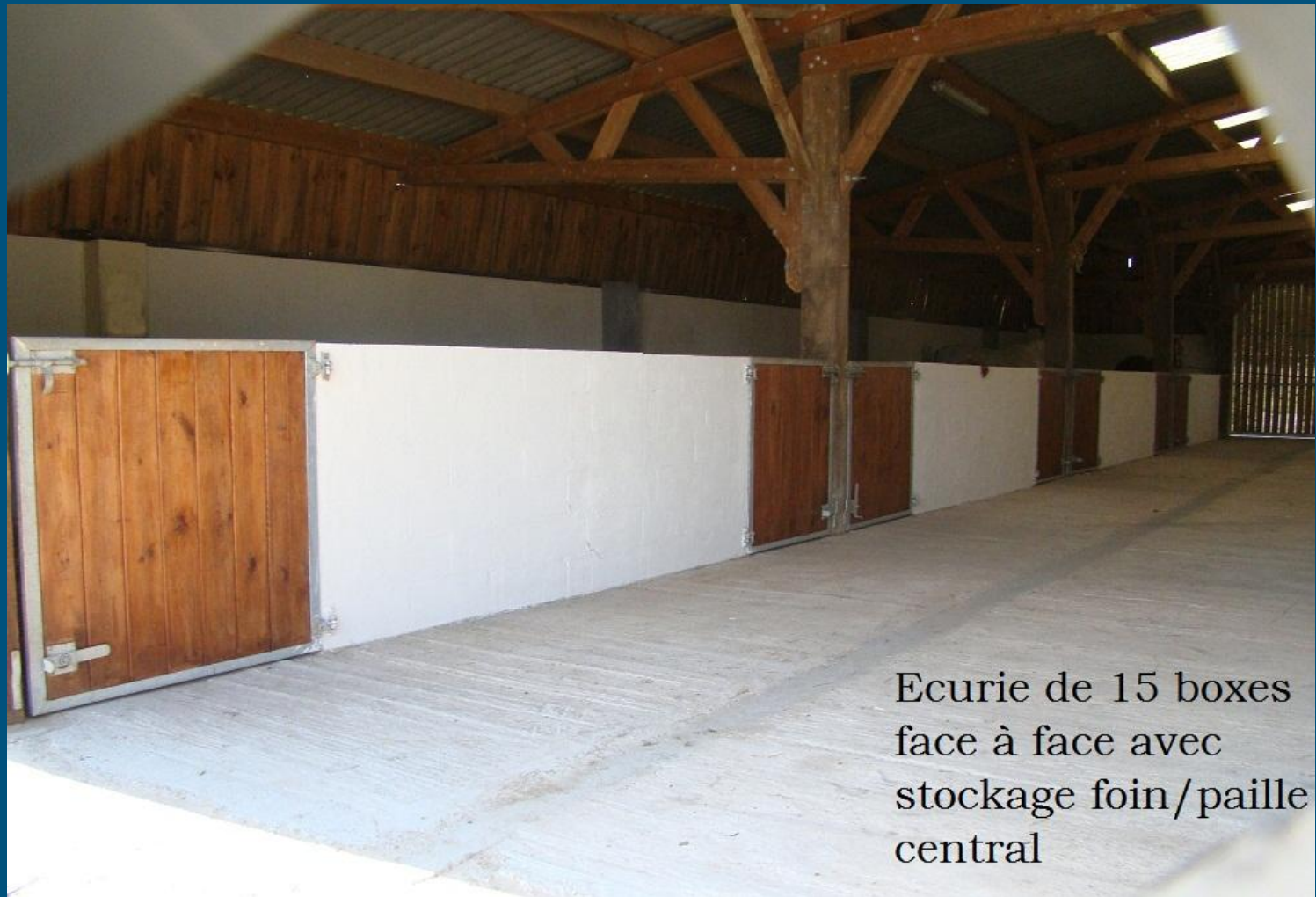
Ecurie de 15 boxes face à face avec stockage foin/paille central