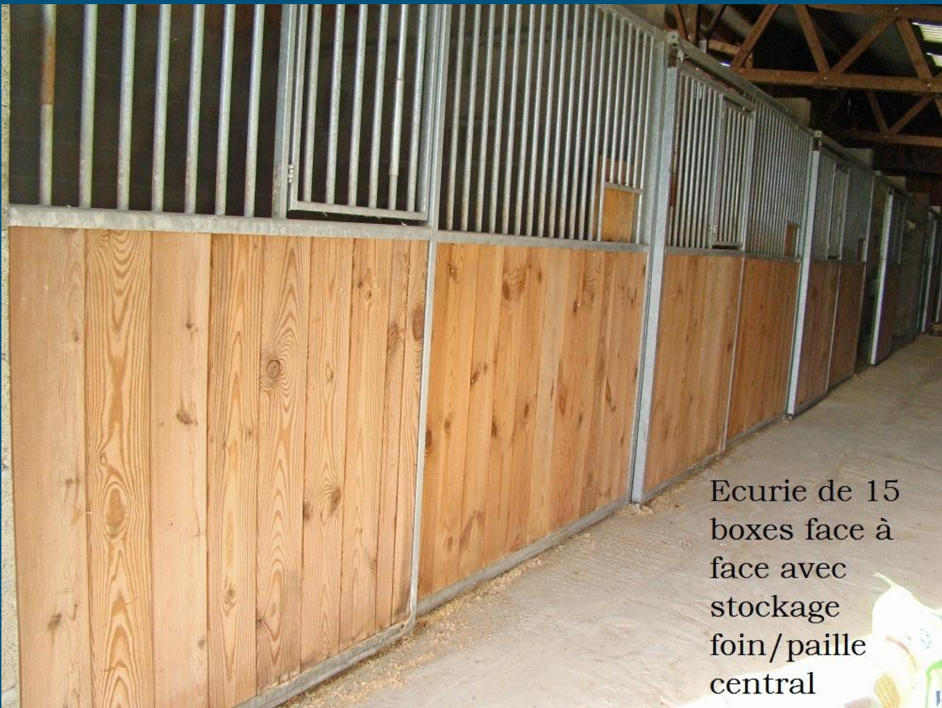
Ecurie de 15 boxes face à face avec stockage foin/paille central