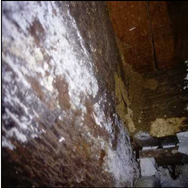
traces de termites sans présence d'individus le jour de la visite sur une poutre de l'escalier