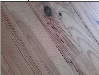
Altérations dans plancher de la chambre 1 sans présence d'individus le jour de la visite