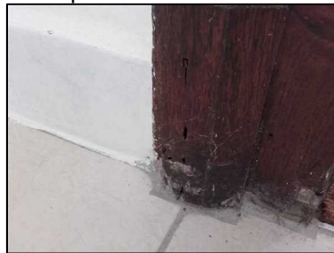
Altérations dans le bois sur montant de porte cuisine sans présence d'individus le jour de la visite