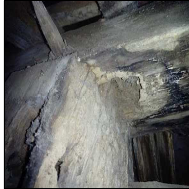
traces de termites sans présence d'individus le jour de la visite sur une poutre dans les combes