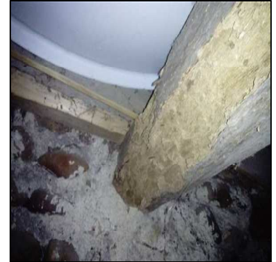
traces de termites sans présence d'individus le jour de la visite sur une poutre de l'atelier