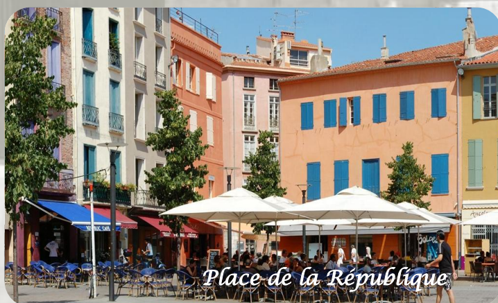
Place de la République

Située dans un environnement privilégié entre mer et montagnes, Perpignan est une ville unique où l'architecture française côtoie l'architecture catalane et espagnole, avec un hyper-centre très étendu.