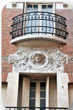
9, bis rue des Marchands PERPIGNAN