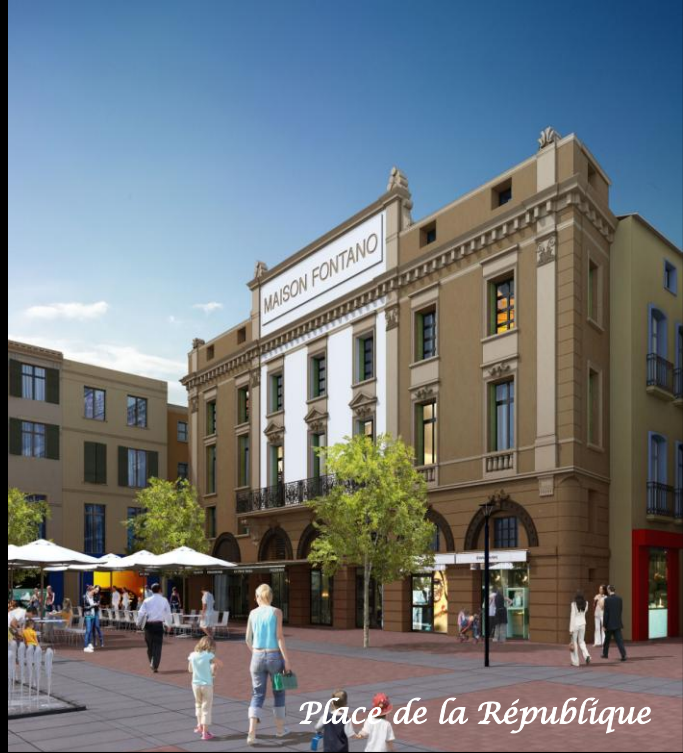
Place de la République