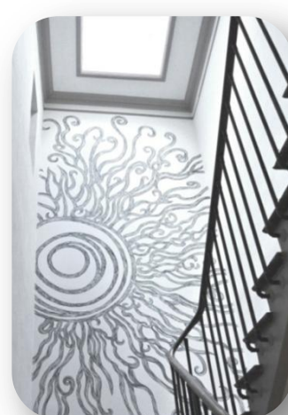
2, rue Saint Jean PERPIGNAN