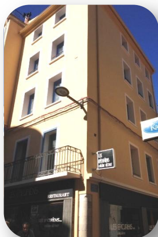
14, rue du Théâtre PERPIGNAN