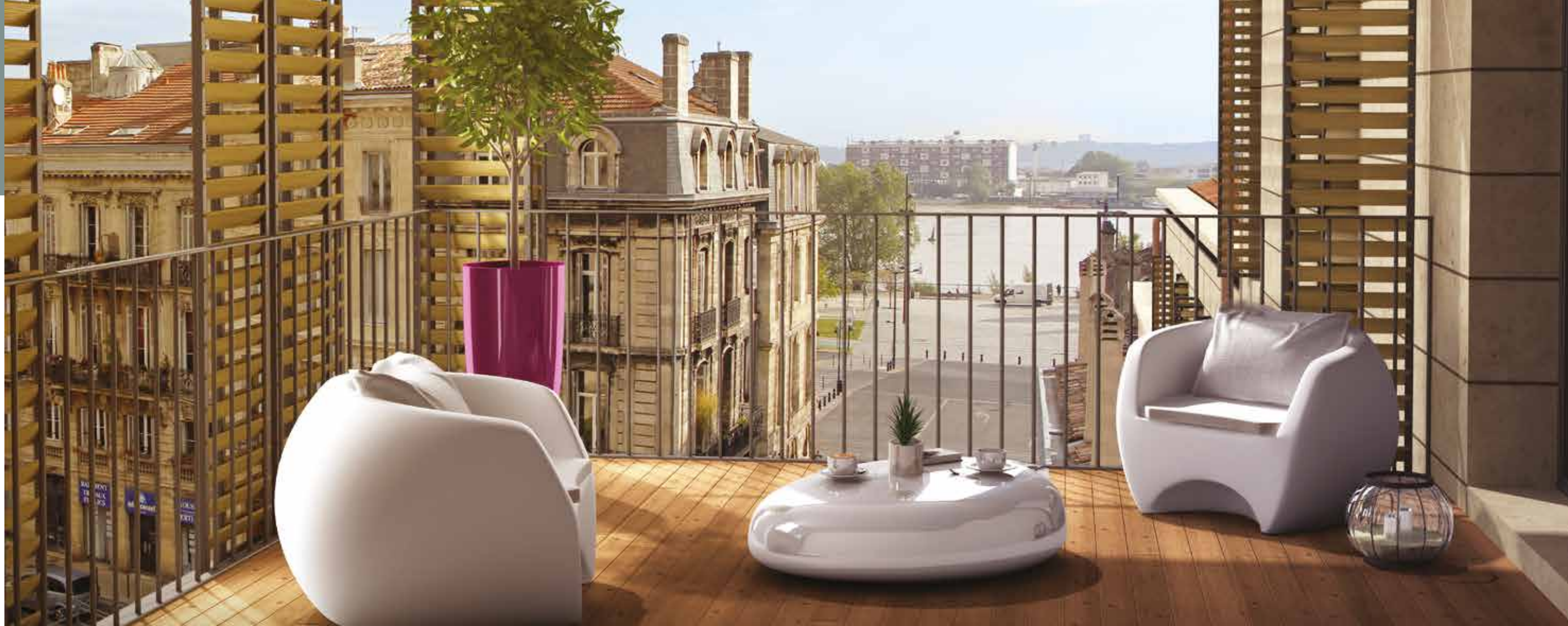
Vue Garonne depuis l'appartement 5 pièces n°403 d'une surface de 108 m 2 .