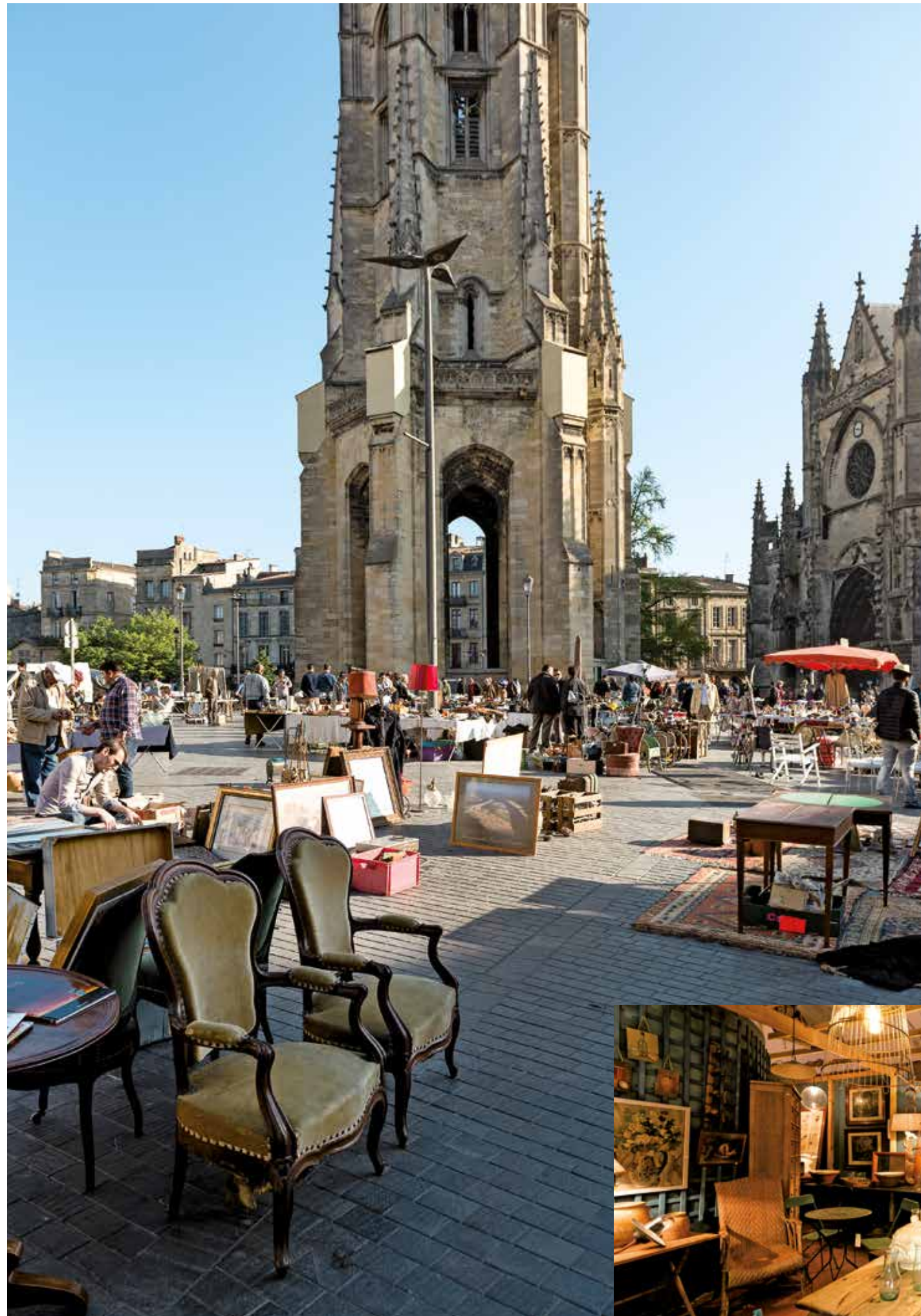
Brocante Place Meynard