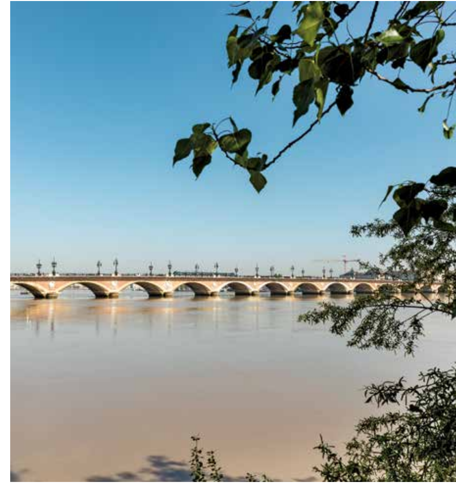
Pont de Pierre

Bordeaux, ville tendance par excellence, arrive en tête des destinations les plus attractives de France. Elle a donné son nom à des crus comptant parmi les plus prestigieux de notre gastronomie. Près de la moitié de la cité est classée au Patrimoine Mondial de l'UNESCO depuis 2007.