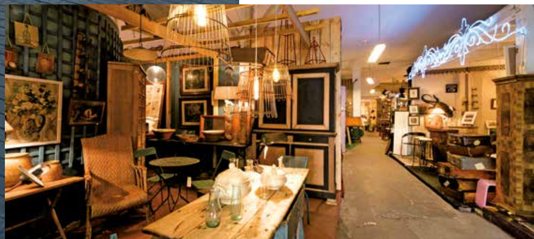
Le Passage Saint-Michel

Le marché animé des Capucins, les brocantes du dimanche matin où chiner est un plaisir, les nombreux commerces et la proximité de la gare Saint-Jean sont autant d'atouts venant renforcer son attractivité et lui conférant un charme intemporel.