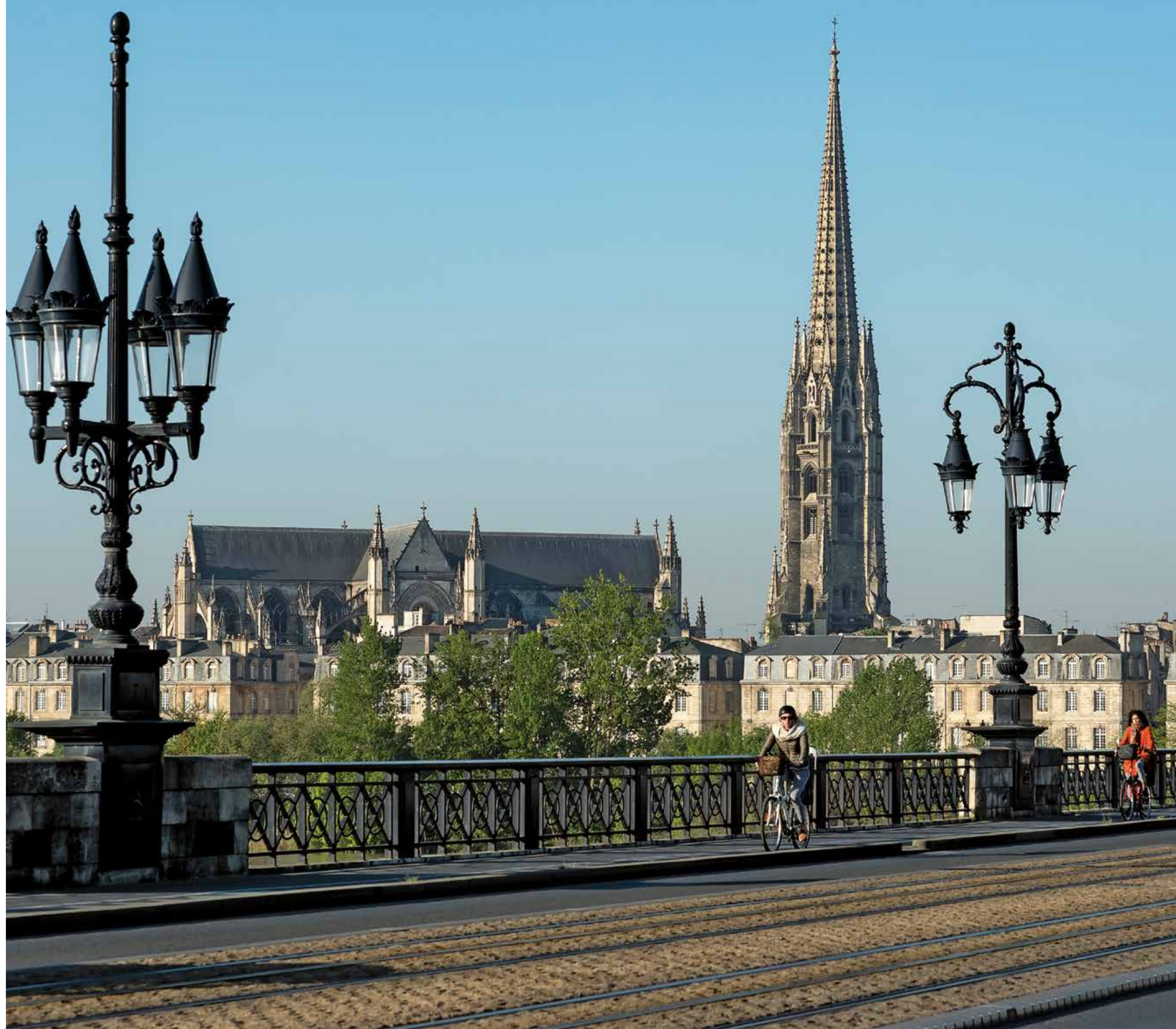
Vue du Pont de Pierre ▶