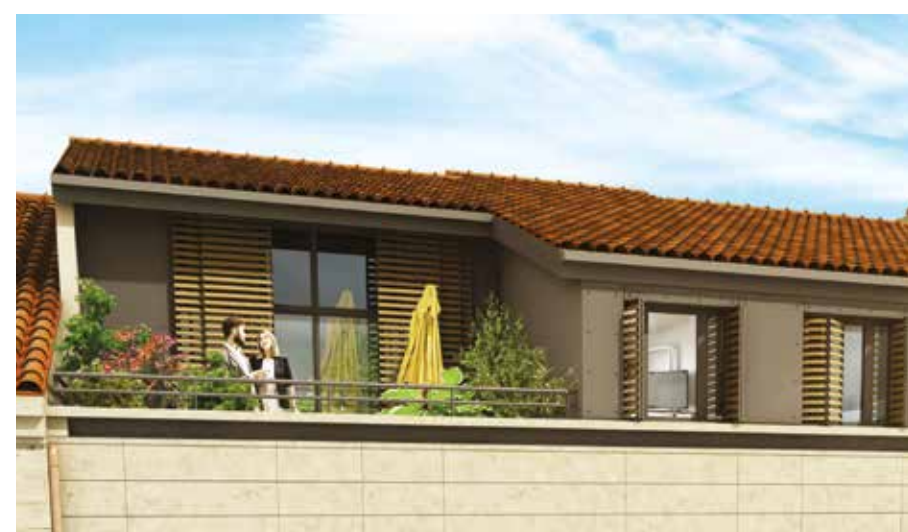
Détail de l'attique rue des Fours.