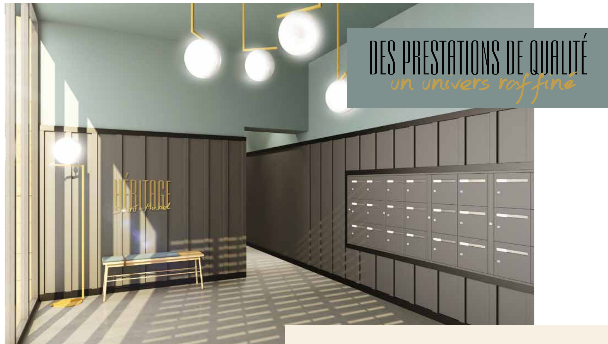
Hall d'entrée imaginé par la décoratrice d'intérieur Valérie GERAUDIE.