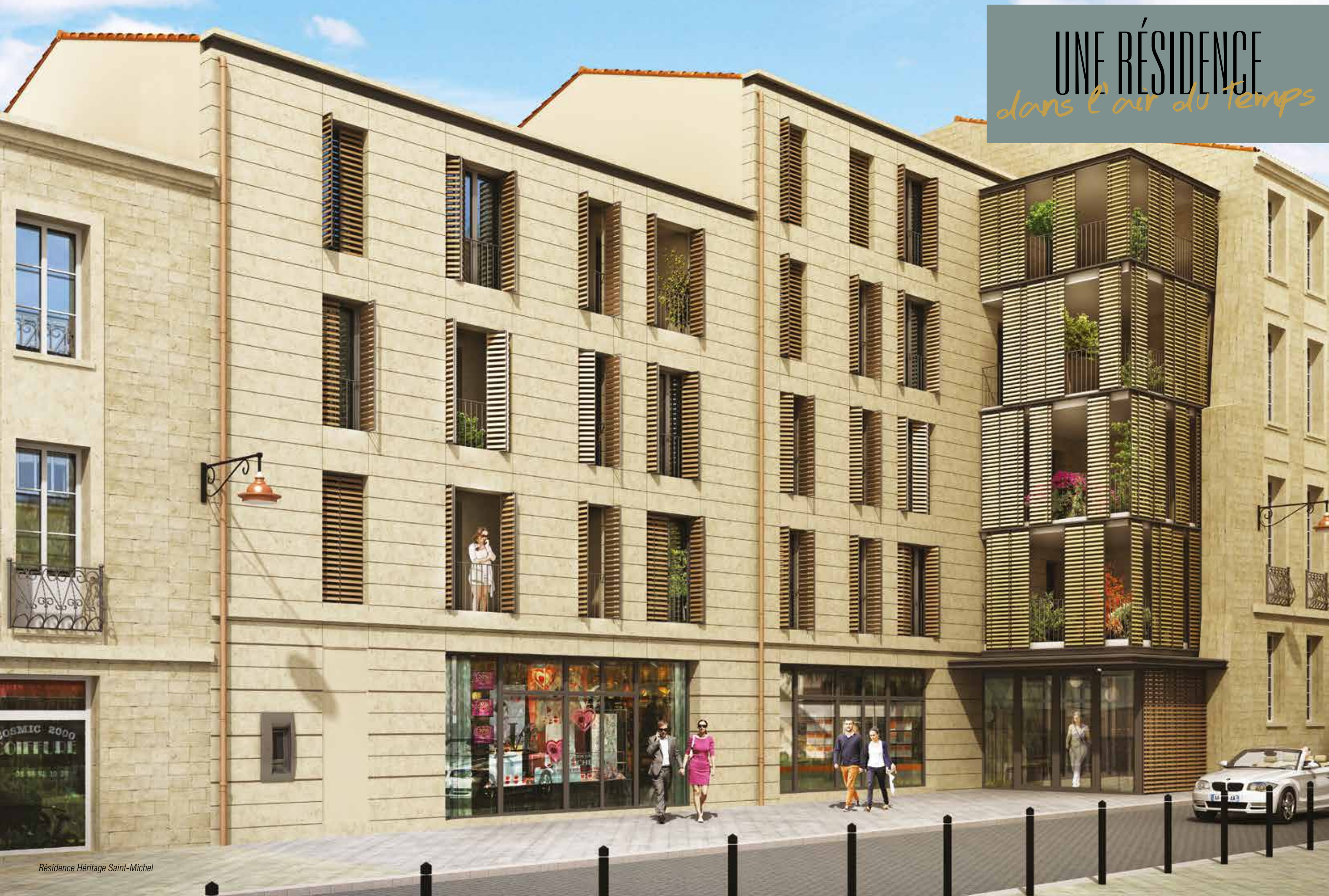
Résidence Héritage Saint-Michel