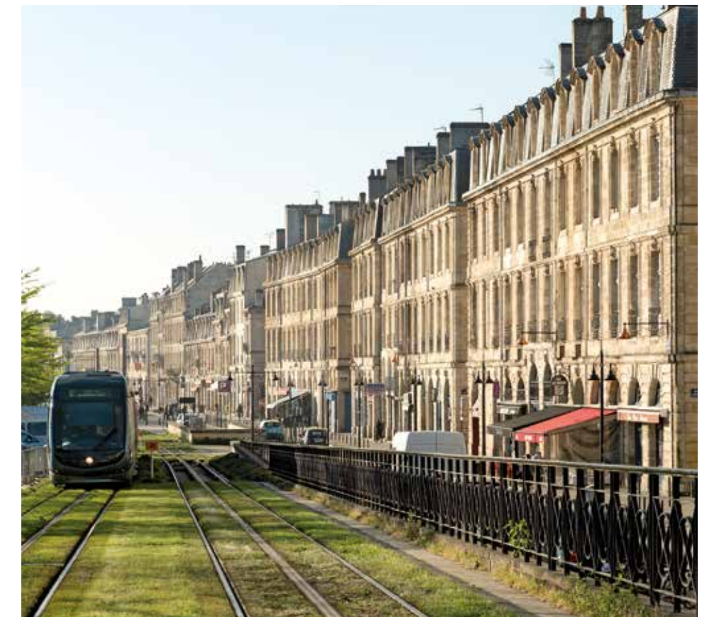
Tram C - Arrêt Saint-Michel