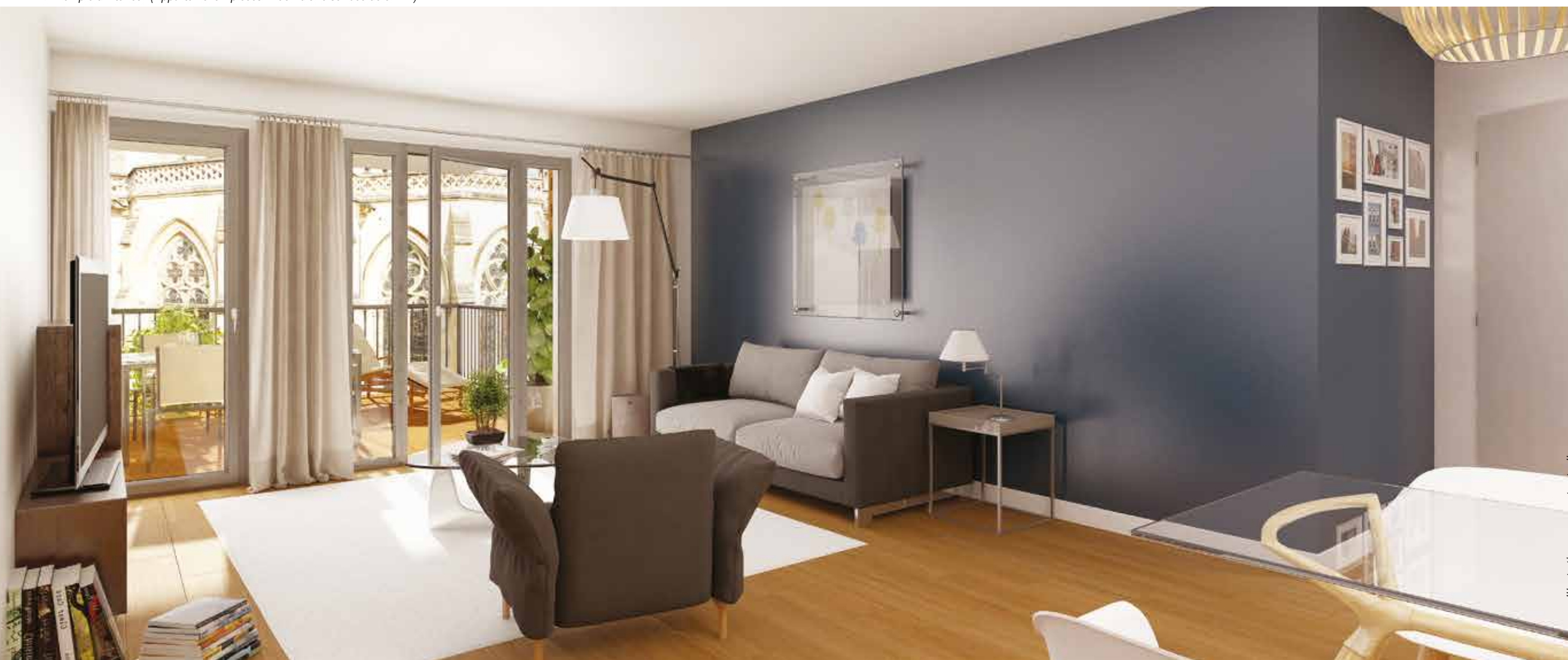
▼ Exemple d'intérieur (Appartement 4 pièces n°304 d'une surface de 97 m 2 ).