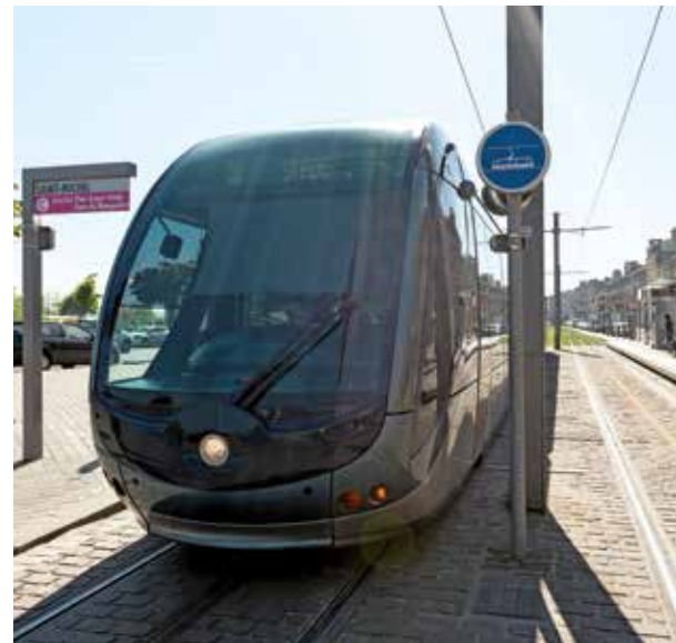
Tram ligne C