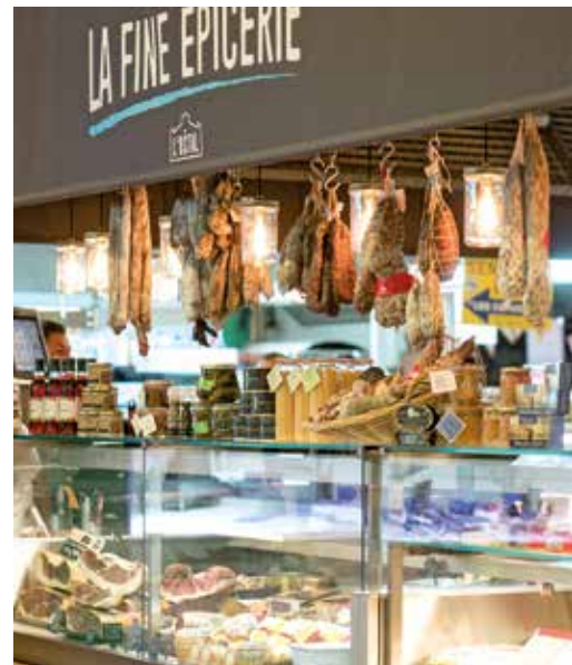
Marché des Capucins

Le marché animé des Capucins, les brocantes du dimanche matin où chiner est un plaisir, les nombreux commerces et la proximité de la gare Saint-Jean sont autant d'atouts venant renforcer son attractivité et lui conférant un charme intemporel.