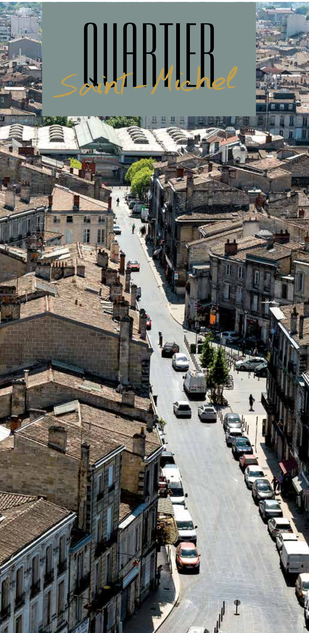
Marché des Capucins