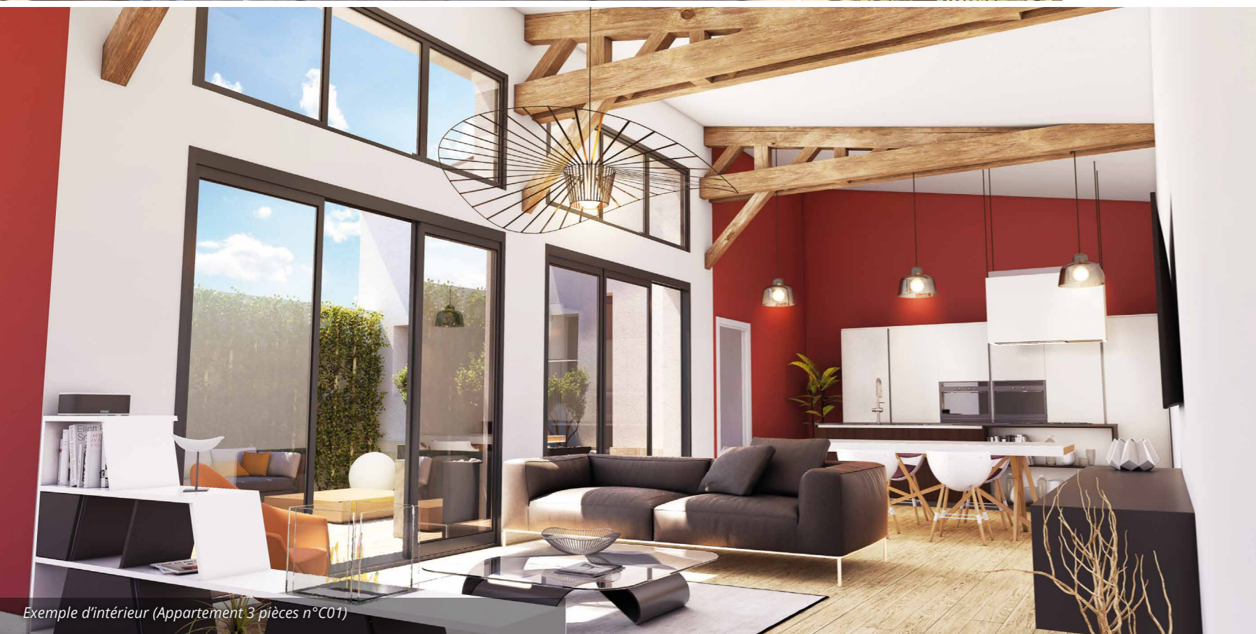
Exemple d'intérieur (Appartement 3 pièces n°C01)