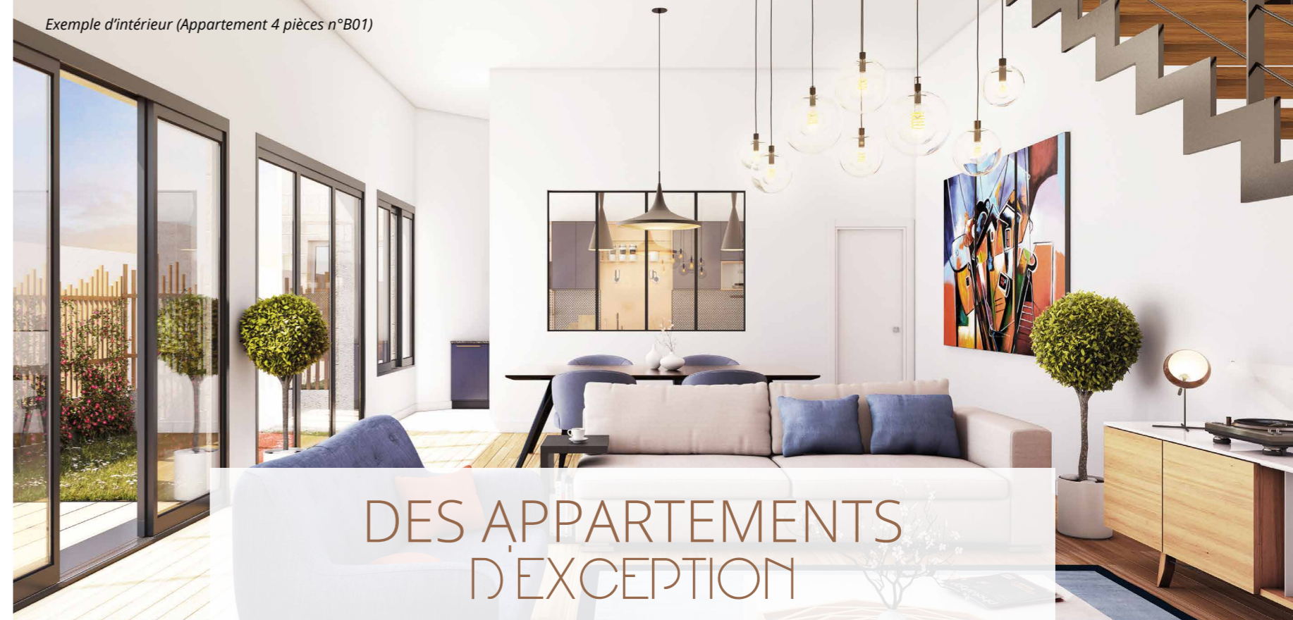
Exemple d'intérieur (Appartement 4 pièces n°B01)

Un espace extérieur privé pour la plupart des logements.