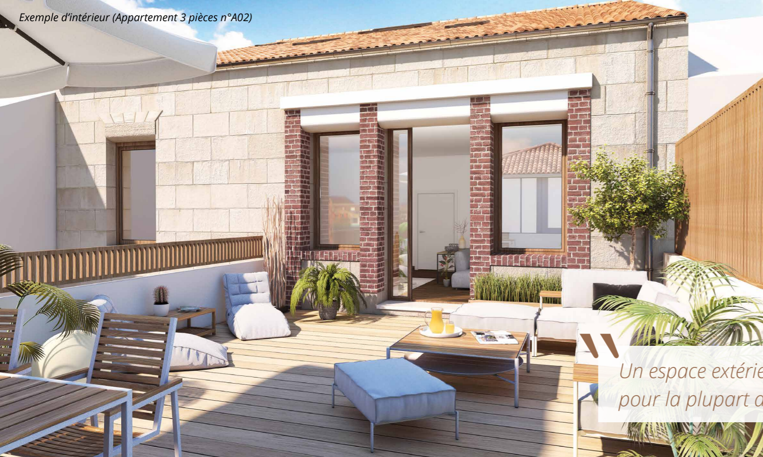
Exemple d'intérieur (Appartement 3 pièces n°A02)

Un espace extérieur privé pour la plupart des logements.