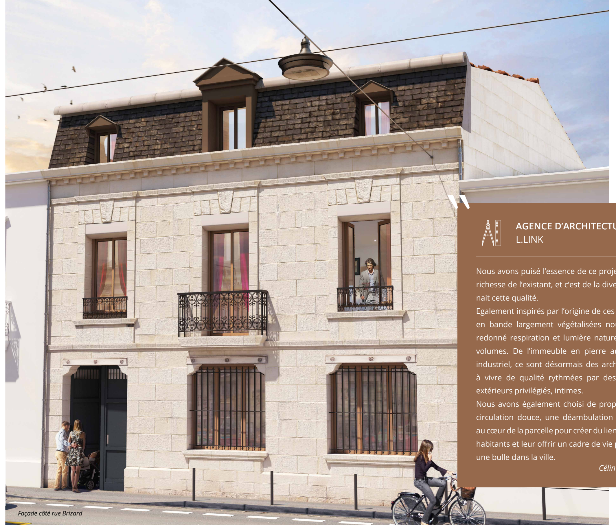
Façade côté rue Brizard

Un style, du caractère et une intimité préservée.