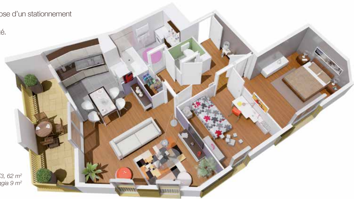
Exemple d'appartement T3, 62 m 2 avec loggia 9 m 2

Chaque appartement dispose d'un stationnement en rez-de-chaussée. Ici, le confort est une priorité.