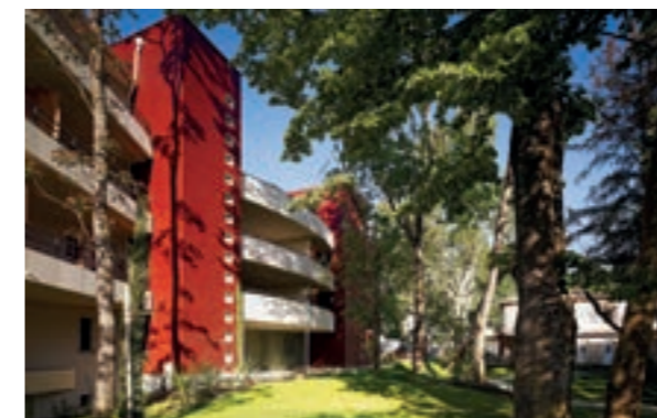
Les Jardins du Golf - Toulouse Architecte Ryckwaert