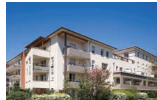
Cassiopée - Colomiers Architecte Martinie