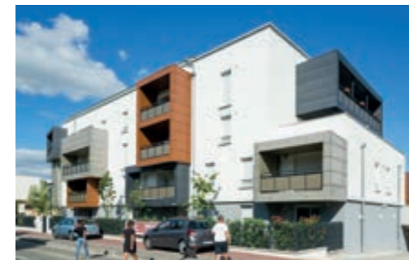
Carré Tolosa - Toulouse Architecte Cabinet Arua