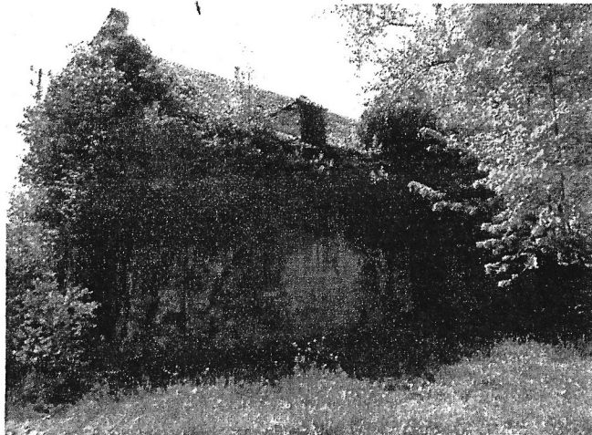
Photo générale du bien

Il n'a pas été repéré de matériaux et produits susceptibles de contenir de l'Amiante.