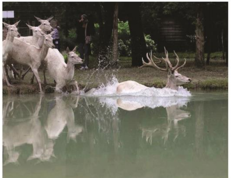
Lorsque le grand cerf se jette à l'eau, c'est tout le troupeau qui suit.

Les cerfs blancs se portent bien ici, comme en témoigne la naissance de deux bébés jumaux au mois de juin. Une rareté filmée en direct par Jean-Charles Birembaut lui-même. Espégle, ce dernier en profite pour mettre en avant son moulin : « Poyaller, c'est pas le zoo de Beauval, mais il y passe aussi des choses intéressantes. »