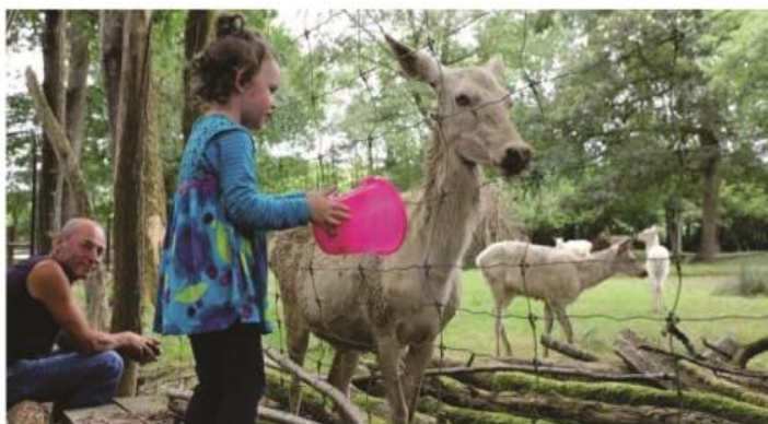
Les visiteurs ont la possibilité d'acheter un seau pour donner à manger aux animaux