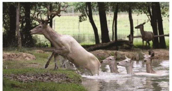
Toutes derrière et lui devant