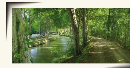
CANAL DU MIDI