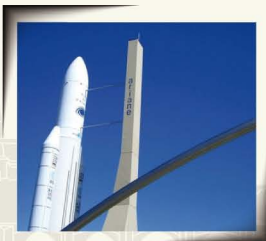
CITÉ DE L'ESPACE