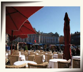
PLACE DU CAPITOLE