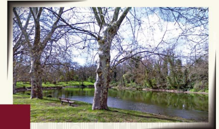
JARDIN DU BARRY