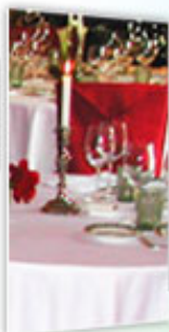
SEMINAIRES ET RECEPTIONS