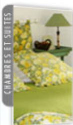
CHAMBRES ET SUITES