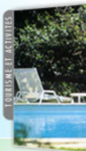
TOURISME ET ACTIVITES