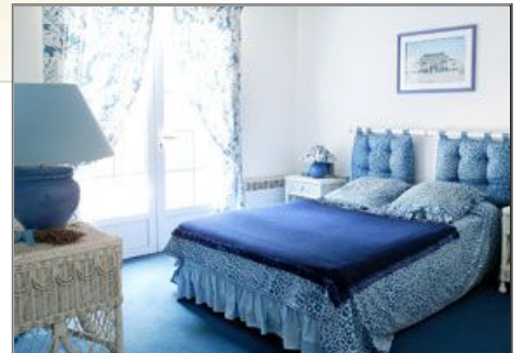
Chambre salon supérieure