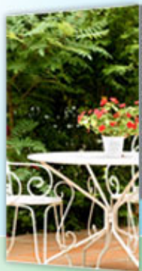
INFORMATION ET RESERVATION