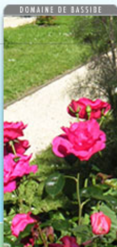
DOMAINE DE BASSIBE