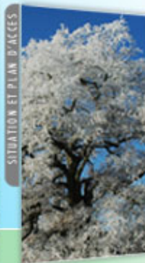
SITUATION ET PLAN D'ACCES