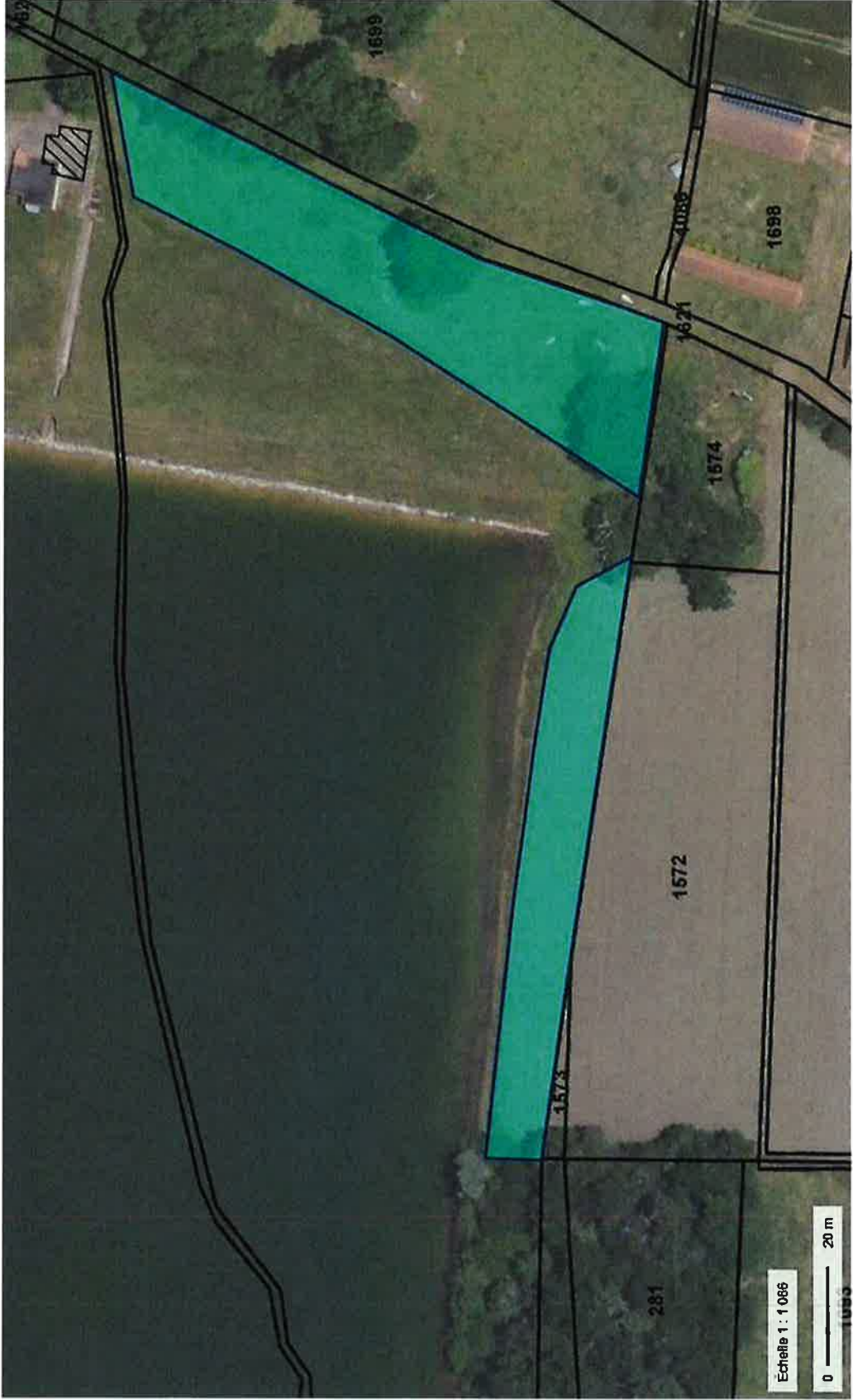
Emprises comodat parcelle A 1692, Monlaur-Bernet