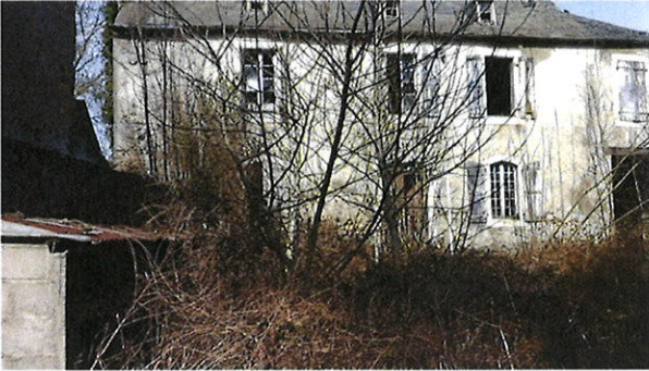
Vue sur l'habitation