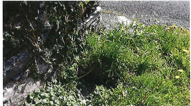
Caniveau privé raccordé sur réseau pluvial de la VC n°1