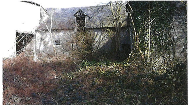
Vue sur les granges