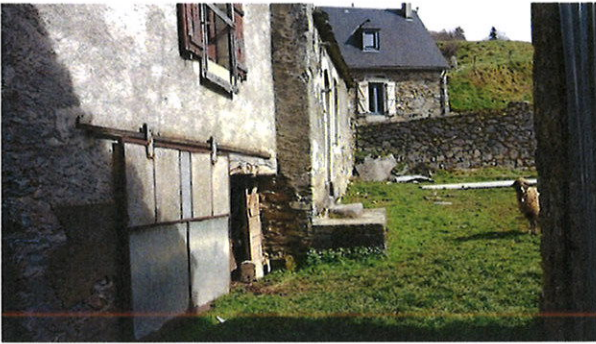
Vue sur la première habitation