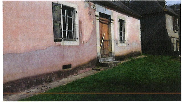
Vue sur la seconde habitation