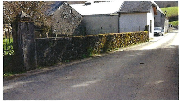
Absence de réseau au droit du terrain le long de la VC n°4