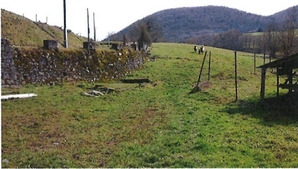
Vue sur le terrain (pente > 10 %)