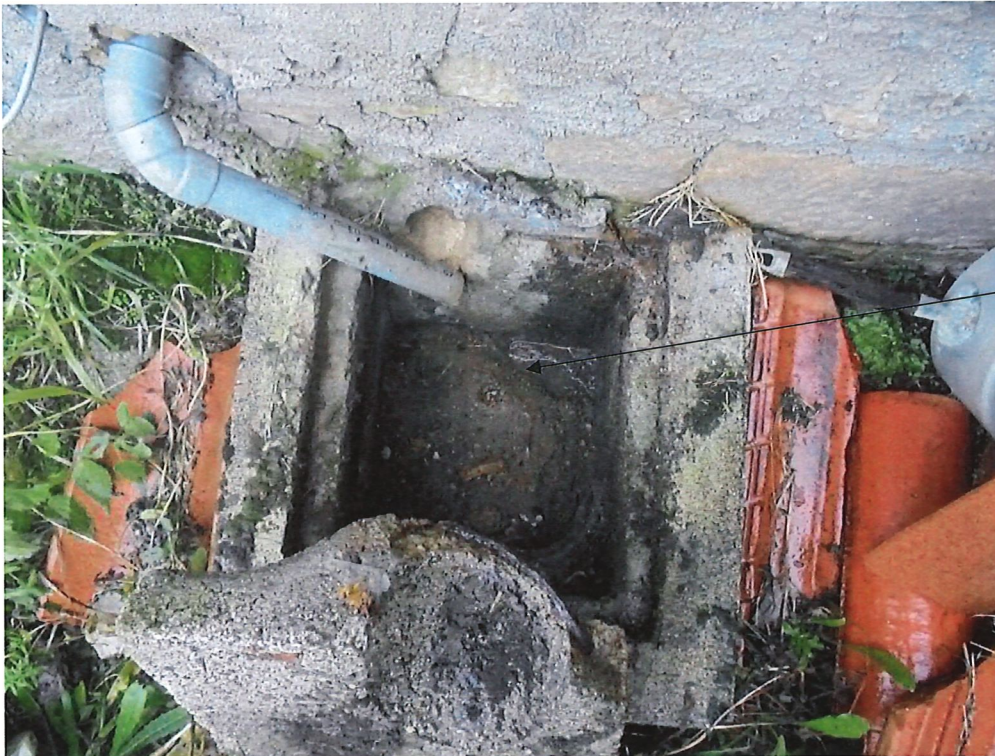
Regard de collecte des eaux issues de la cuisine et du lave-linge