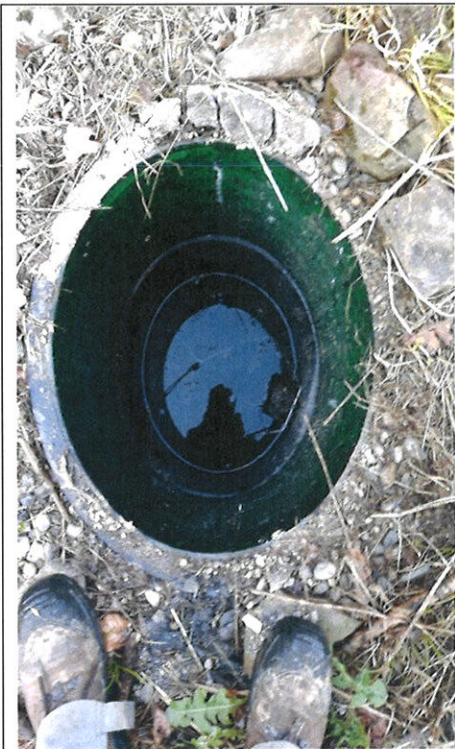
Fosse toutes eaux