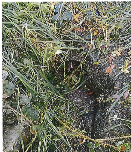
Rejet dans fossé privé