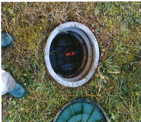
Fosse toutes eaux