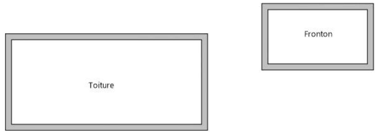
Plan de masse