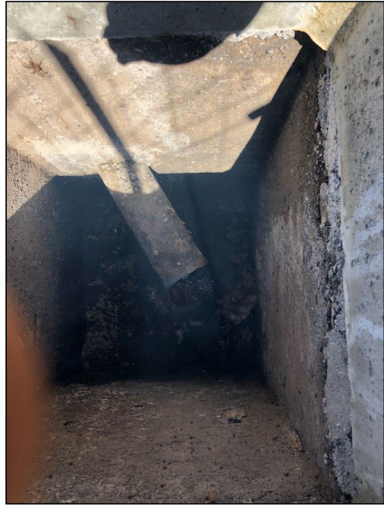
Regard RB après mise en conformité