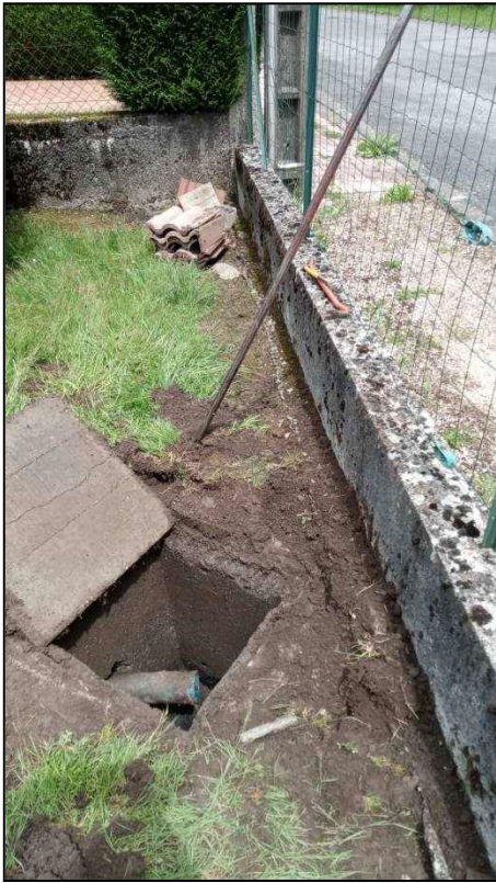
Regard RB avant mise en conformité