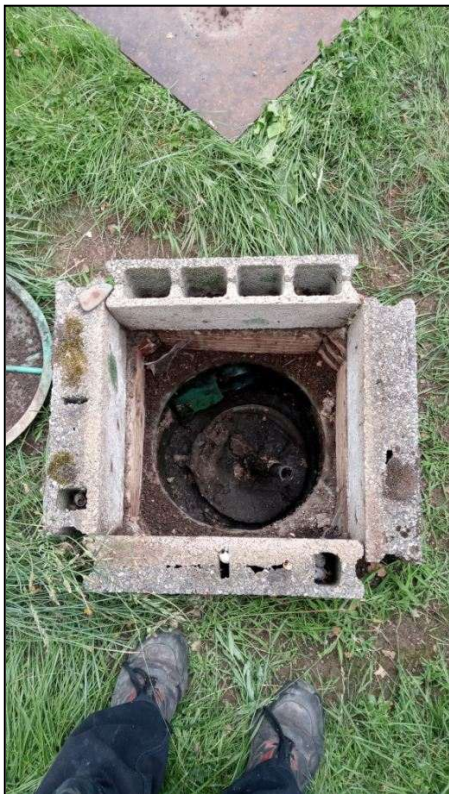
Regard boîte à graisses avant