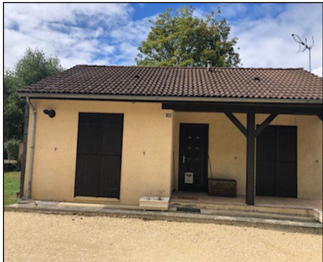
Regard boîte à graisses après suppression