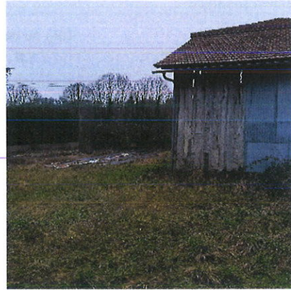
Vue sur le terrain Présence de deux 'hangars'