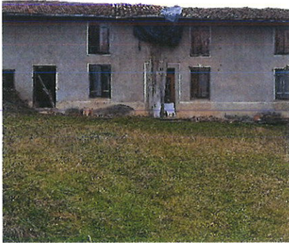
Vue sur l'habitation Façade frontale