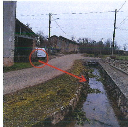
Evacuation du regard avaloir (cercle rouge) dans le "Ruisseau du Barès" au niveau de la flèche rouge