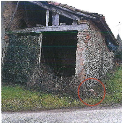
Vue sur la dépendance située derrière l'habitation Le regard avaloir se situe dans l'angle nord-ouest (cercle rouge)