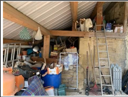
Photo n° Appenti Localisation sur croquis : Appenti Description : Encombrement trop important