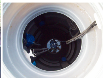
Poste de relevage