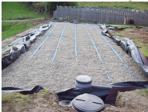
Lit filtrant vertical drainé à massif de sable