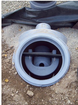
Chasse à auget