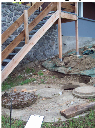
Fosse toutes eaux n°1