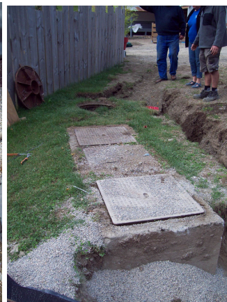
Fosse toutes eaux n°2