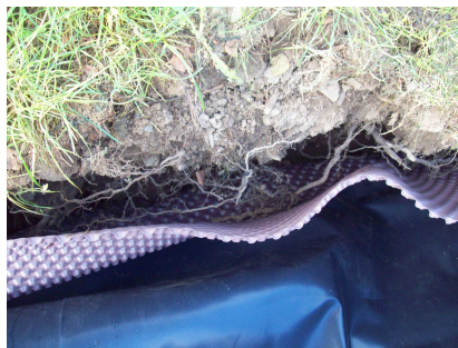
Barrière anti racine