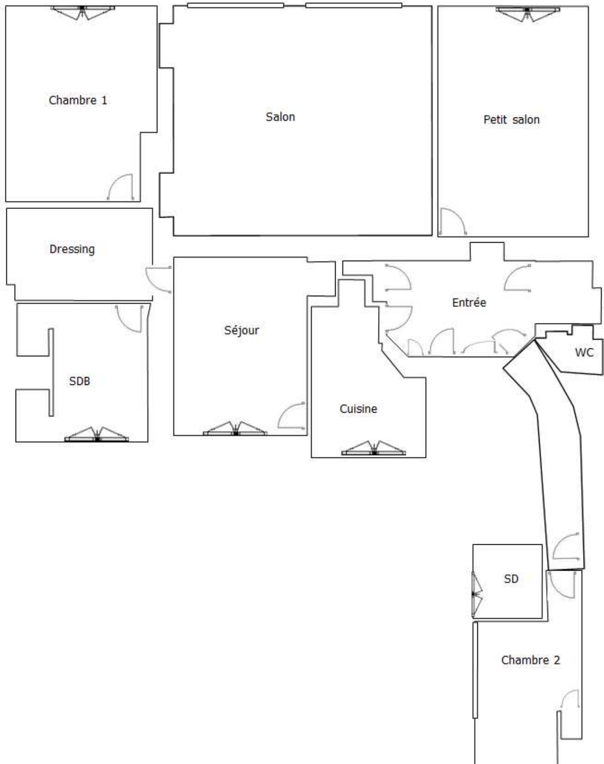
Schéma de repérage