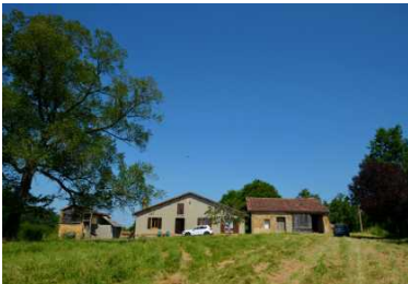
MANCIET - Maison