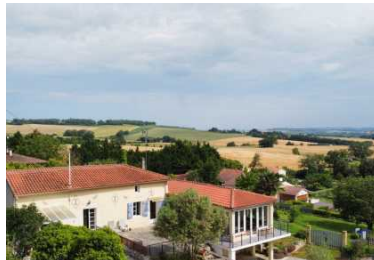
CASTERA-VERDUZAN - Maison